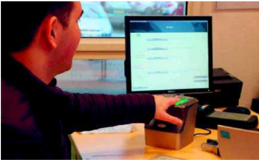
Les communes déjà habilitées pour le passeport biométrique feront aussi les cartes d'identité

(1) Bordeaux, Mérignac, Pessac, Talence, Gradignan, Villenave d'Ornon, Bègles, Cenon, Lormont, Blanquefort, Eysines, Saint-Médard-en-Jalles, Le Bouscat.