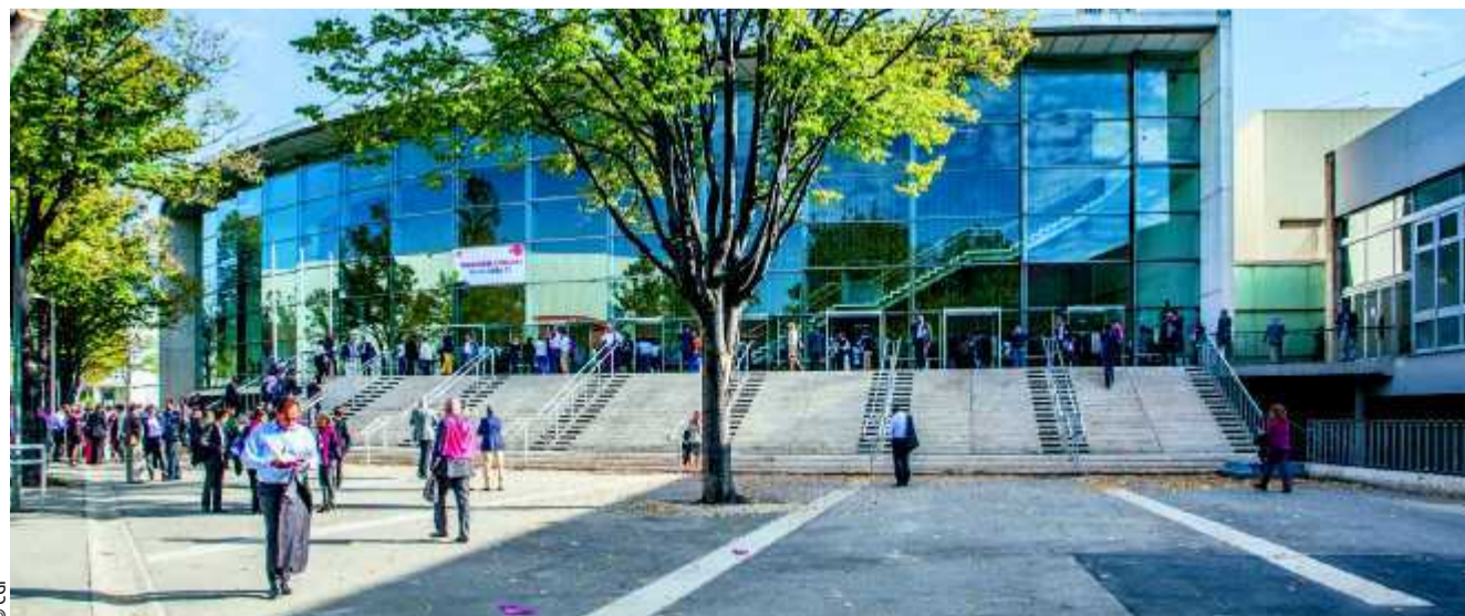
On compte 95 % de CDI à l'embauche*.

Considéré comme l'un des piliers de l'économie française, le «B to B» est aujourd'hui l'un des secteurs pourvoyeurs d'emplois. 120 000 entreprises hexagonales portent le commerce de gros et international, tout en fédérant plus d'un million de salariés. Elles représentent la moitié de la richesse produite par l'ensemble du commerce du pays. A l'heure où beaucoup de jeunes s'interrogent sur leur avenir et entendent trouver un emploi stable et rémunérateur, le «B to B» constitue une filière d'excellence. On y compte 95 % de CDI à l'embauche*, rappellent CGI et Intergros, qui se mobilisent au cœur de ces filières qui recrutent parmi des commerciaux, des logisticiens ou encore des professionnels du marketing. Les formations s'avèrent également très ouvertes, avec des cursus du CAP au Master, en passant par les bacs pro ou les BTS. • Pour tout savoir sur le «B to B», les formations et les offres d'emploi, mybtob.fr