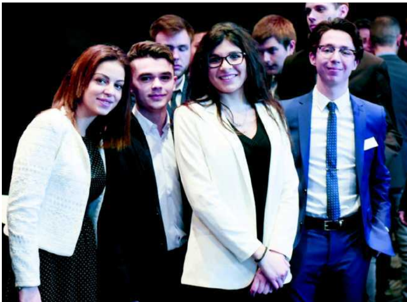
Plusieurs villes vont faire découvrir les opportunités professionnelles du milieu.

Souvent méconnu mais porteur, le secteur du commerce «Business to business» organise aujourd'hui une journée spéciale afin de faire découvrir la diversité de ses métiers aux jeunes.