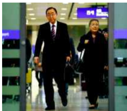
Le Sud-Coréen renonce à la présidentielle.

Il ne sera pas l'homme providentiel. Alors que la Corée du Sud traverse une crise politique sans précédent, l'ex-secrétaire général de l'ONU, Ban Ki-moon, a renoncé hier à se présenter à la présidentielle dans son pays, déjouant les attentes des observateurs. «Je vais me retirer de la vie politique», a annoncé le diplomate, récemment rentré à Séoul après huit ans à la tête des Nations unies. Face aux accusations de corruption formulées contre certains de ses proches, il a évoqué «l'esprit de clocher et l'égoïsme» des milieux de pouvoir, justifiant sa décision. Sa popularité était tombée ces dernières semaines, pour s'établir autour de 13 %. •