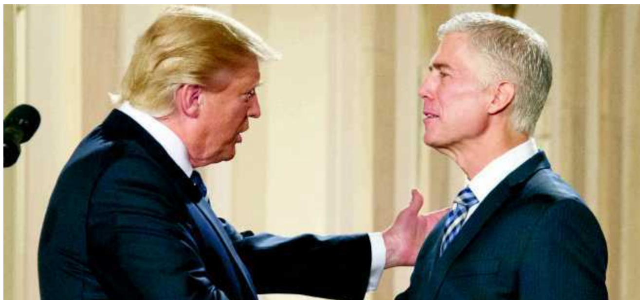
Avec Neil Gorsuch, Donald Trump a choisi un ardent défenseur de la Constitution.

A 49 ans, il pourrait devenir le plus jeune magistrat de la juridiction. Mais le juge Neil Gorsuch, proposé mardi soir par Donald Trump pour remplacer le défunt Antonin Scalia à la Cour Suprême des Etats-Unis, n'y jouera pas le rôle du révolutionnaire. Ce brillant juriste, qui doit encore être validé par le Sénat, revendique en effet une interprétation