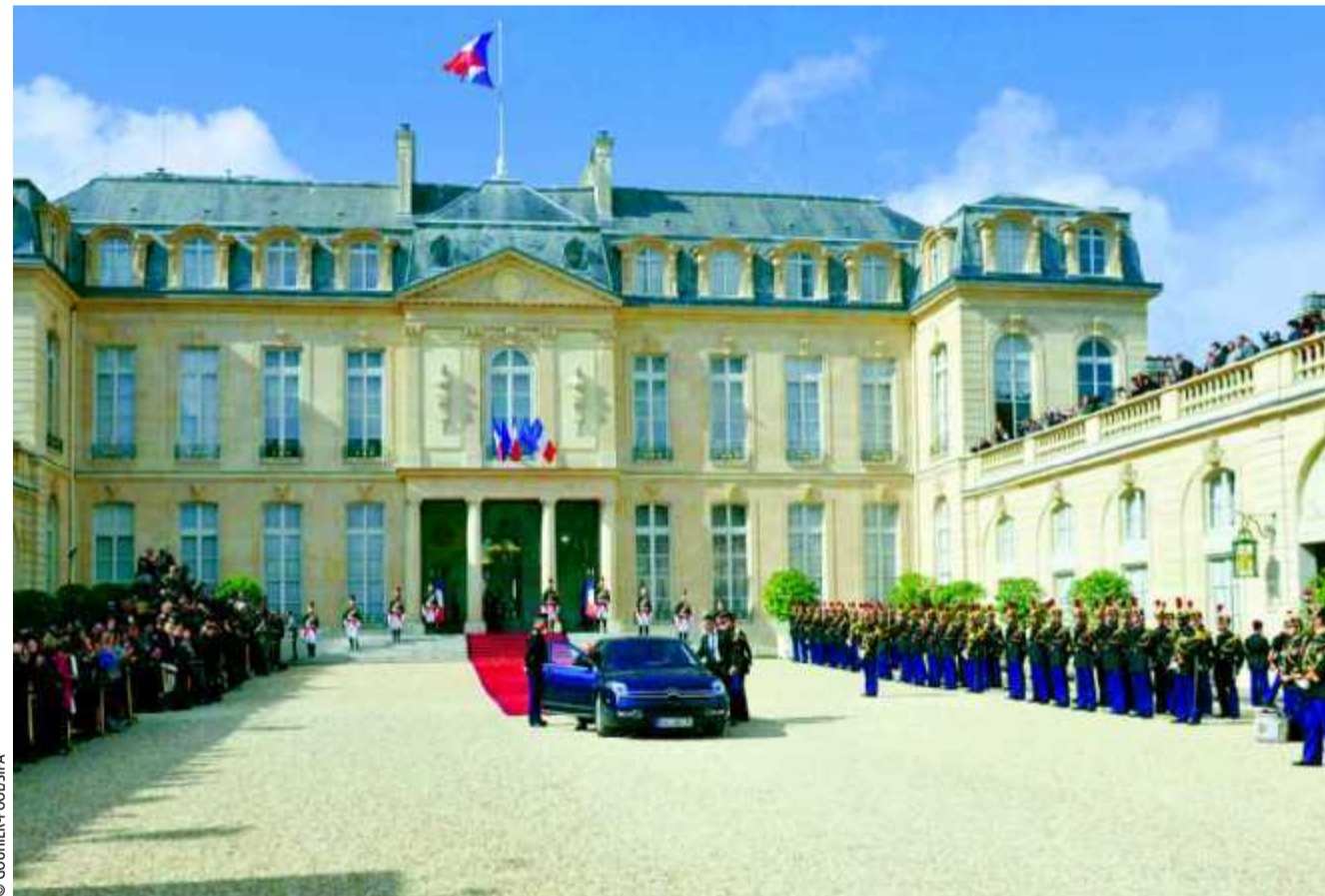
Entre rejet des vieux clivages et mise à l'écart des sortants, il est difficile de prédire qui deviendra le prochain locataire de l'Élysée.